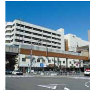
札幌の副都心「新さっぽろ」。地域に密着した生活関連店舗が集まっています。(新札幌高架 新札幌駅付近)