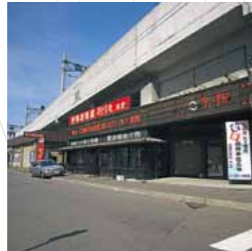
札幌駅南口商業施設との一体感ある駅周辺高架下飲食店舗です。(札幌高架 西1丁目)