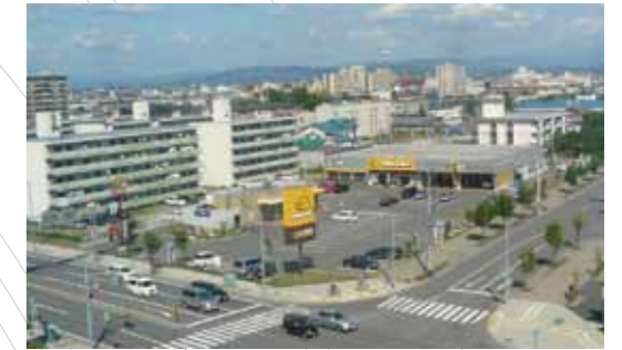
大雪通に面してアクセスが良く、物販店舗、飲食店舗が集積したショッピングセンターです。(旭川市 宮前ショッピングセンター)