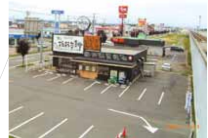
帯広市内のロードサイド型飲食店舗です。(帯広高架 柏林台駅付近)