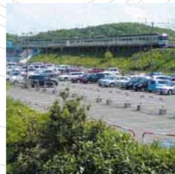
国道274号線等の幹線道路からのアクセスが良い駅前駐車場です。(上野幌)