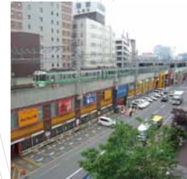
kitaca電子マネーでご利用頂ける駐車場を併設した札幌駅西口エリアの高架下店舗群です。(札幌高架 西6丁目付近)