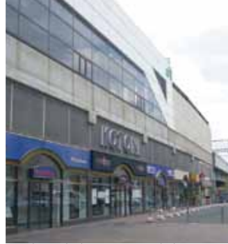
琴似ステーションプラザ