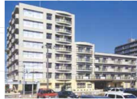
女性専用賃貸マンションとして建設。北14条東4丁目天使大学そばです。[142室] (アンジェリーク・コア)