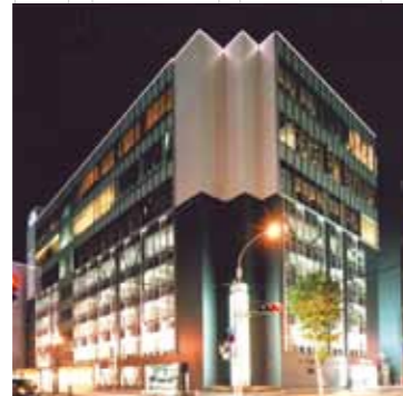
24h駐車場が併設されたスタイリッシュな空間で、北海道の新鮮な素材を活かした料理を堪能できます。(JR55 SAPPORO)