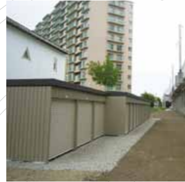
季節用品等の保管に便利なレンタル物置を「Jトランク」ブランドで展開しています。(八軒)