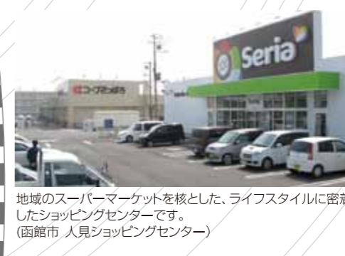
地域のスーパーマーケットを核とした、ライフスタイルに密着したショッピングセンターです。(函館市 人見ショッピングセンター)