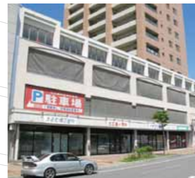
「北広島駅」に隣接した商業施設で地域の暮らしをサポートしています。(北広島エルフィンプラザ)

札幌圏や地方都市圏の鉄道沿線価値の向上に努め、札幌駅周辺において魅力あふれる都市空間を提供していきます。