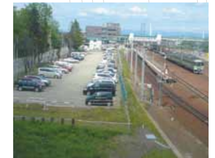
札幌方面への区間列車始発駅の駐車場です。(江別)

札幌圏や地方都市圏の鉄道沿線価値の向上に努め、札幌駅周辺において魅力あふれる都市空間を提供していきます。