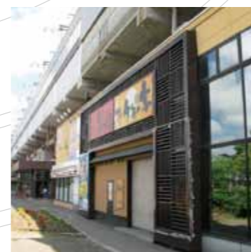
駅と街をむすぶアーケードスペースに開発された機能的な複合商業施設です。(千歳高架 千歳駅付近)