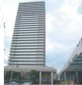
琴似タワープラザ 多様性が求められる街「琴似」。医療、美容、物販店舗の展開により多くのニーズに応えています。(琴似タワープラザ・琴似ステーションプラザ)