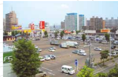
札幌の都心に立地し、物販店舗、飲食店舗、医療施設等を集積した利便性の高いショッピングセンターです。(札幌市 鉄東ショッピングセンター)