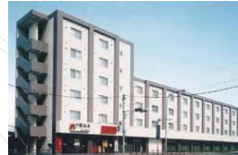
大麻駅徒歩1分、1階には便利な店舗と、恵まれた生活立地の賃貸マンションです。[34室] (グランセリオ大麻)