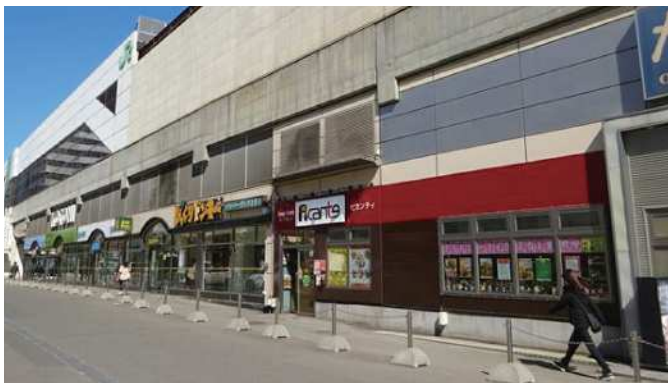
琴似ステーションプラザ (A棟)