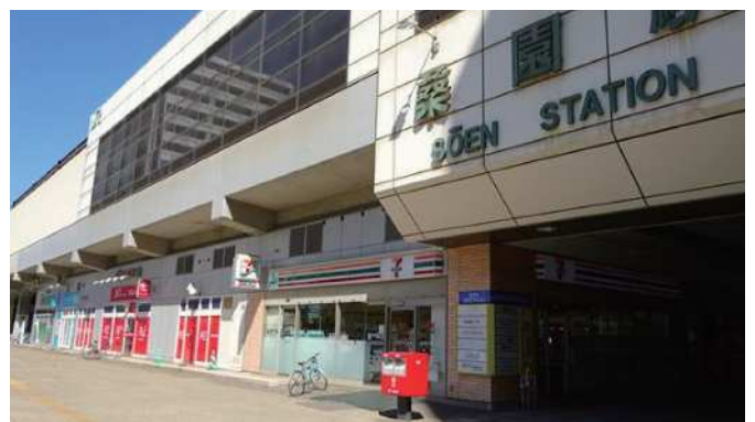
桑園ウエストプラザ