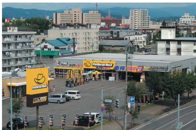
旭川宮前ショッピングセンター