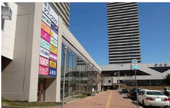
琴似タワープラザ