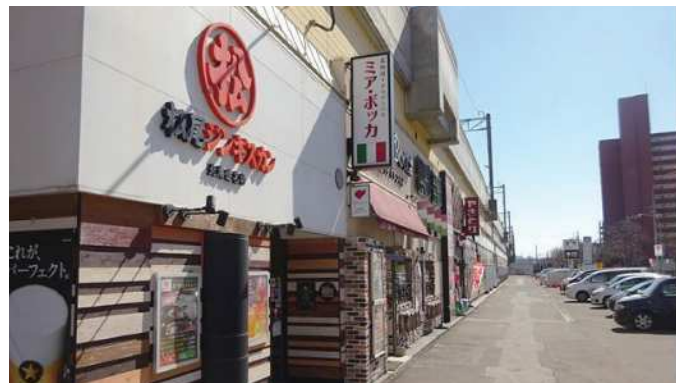
琴似ステーションプラザ (B棟)