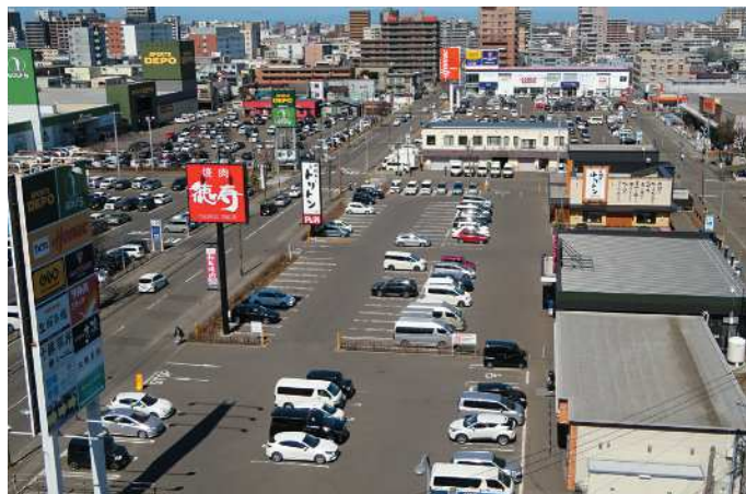
鉄東ショッピングセンター

飲食店主体の施設も展開。十分な駐車場を確保し、広いエリアからのご利用を可能にしています。