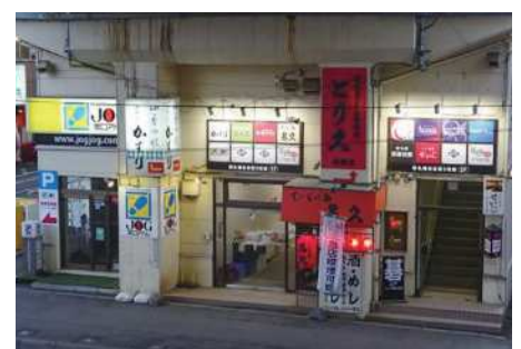
新札幌名店街3号館