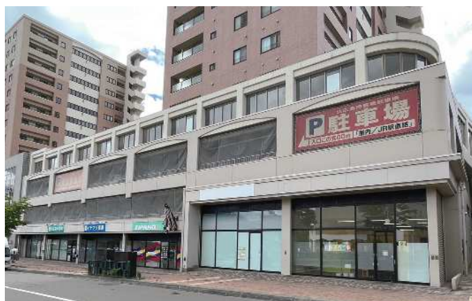
北広島エルフィンプラザ