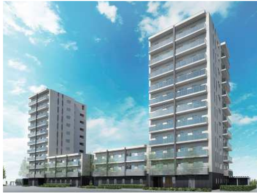
(仮称) ジュノール桑園 完成予想図 ※2024年春開業予定