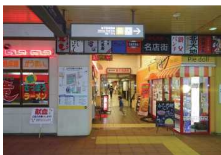
新札幌名店街1号館