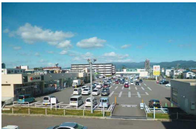
函館人見ショッピングセンター