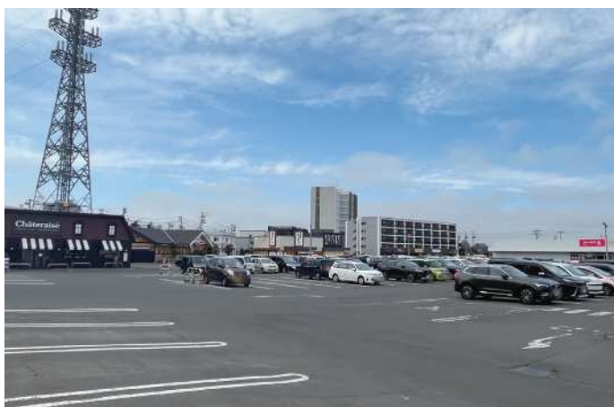
手稲鉄北ショッピングセンター