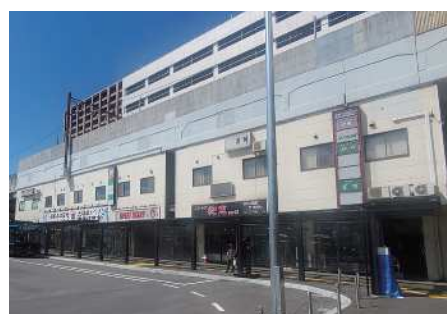
新札幌名店街2号館