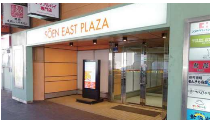
桑園イーストプラザ